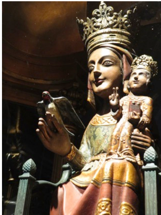
Virgen de Queralt

Es a través de caminar en simplicidad y silencio que cultivaremos los valores de esta peregrinación para revivir nuestra propia espiritualidad en tiempos modernos, siendo uno con los elementos y conectando desde nuestros corazones con la energía amorosa del destino simbólico de la Virgen de Queralt.