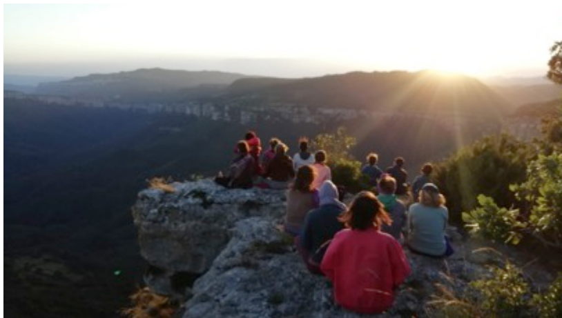
canto meditativo al atardecer