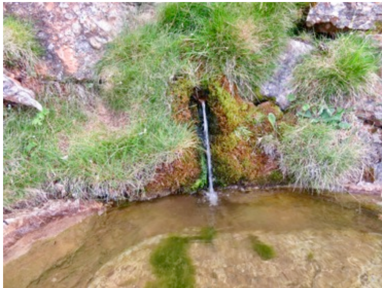
fuelle en el camino

Caminamos por caminos sanadores y transformadores por nosotros, por la tierra y por todos los seres.