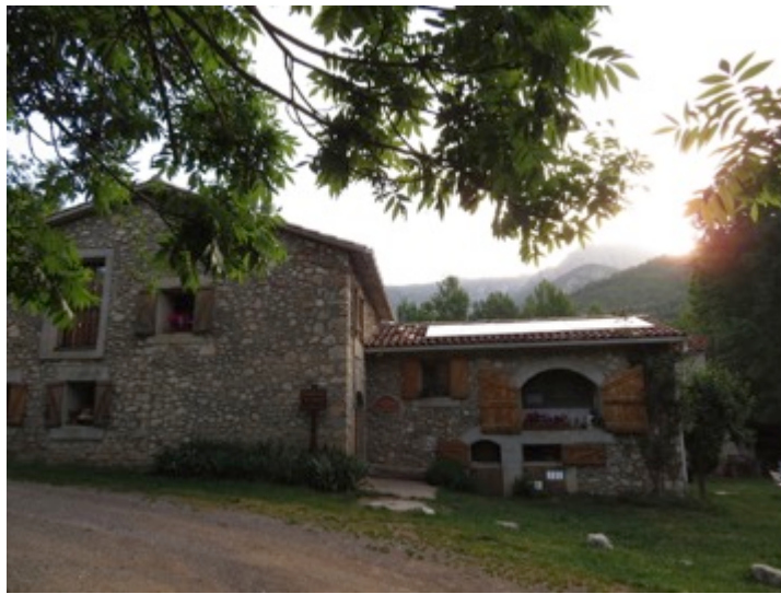
refugio "Molí de Gòsol" donde pasaremos la 3ra noche

-El grupo estará limitado a un mínimo de 5 y un máximo de 12 participantes .