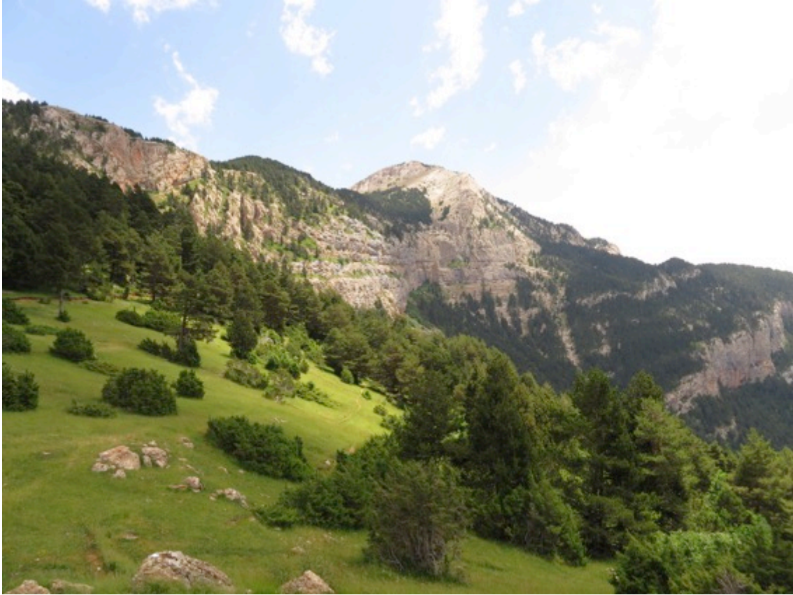
Acantilado de “la Gallina Pelada”